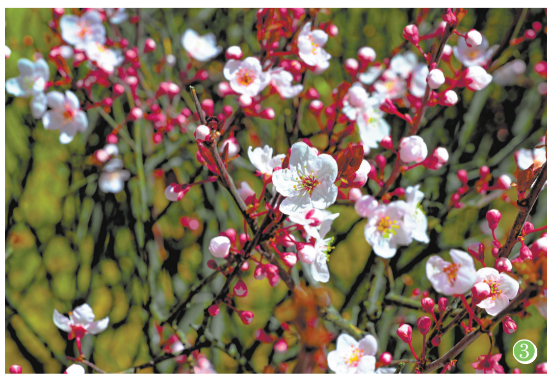
图①:春到拉萨美如画。 图②:市民在公园踏青赏花。 图③、④、⑤:春意盎然、花开枝头。 图⑥:绘画爱好者在公园写生。 图⑦:春花烂漫,吸引不少市民游客驻足拍照、休闲漫步。 图⑧:缀满枝条的柳芽。