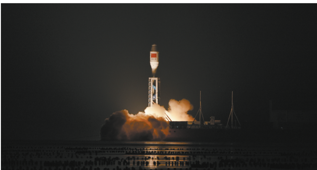
图片均为3月22日23时49分,我国太原卫星发射中心在山东海阳附近海域使用捷龙三号运载火箭,成功将微厘空间02组卫星发射升空,卫星顺利进入预定轨道,发射任务取得圆满成功。(新华社发)