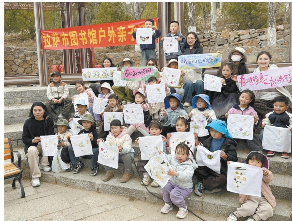
图为活动现场,亲子展示拓印作品。