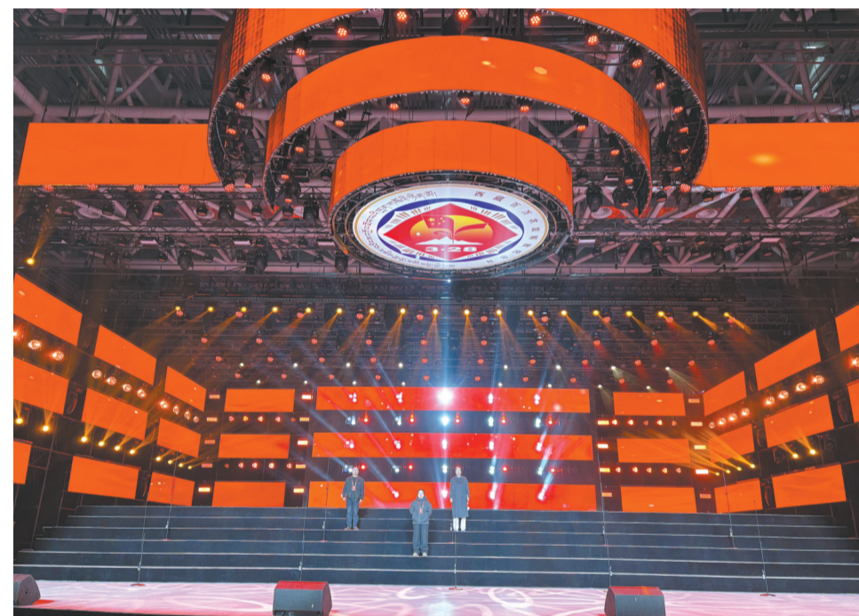
图为舞美灯光效果。

目前,各参赛队伍正与舞台技术团队紧密配合,进行精细化打磨。随着各项彩排工作的有序推进,参赛选手即将在升级的舞美灯光加持下,为西藏民主改革67周年献上一场饱含深情与祝福的文化演出。