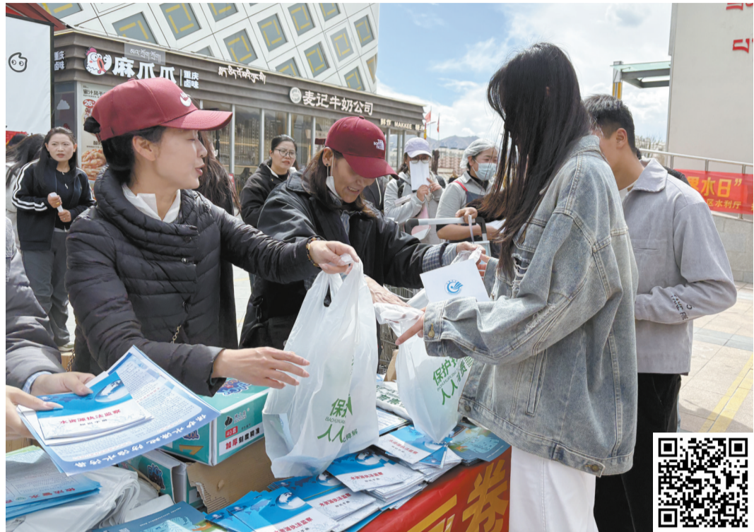
解日常节水技巧,发放宣传材料。

本次活动是拉萨深入贯彻习近平总书记“节水优先、空间均衡、系统治理、两手发力”治水思路的具体实践,也是落实国家节水行动、着力创建国家生态文明