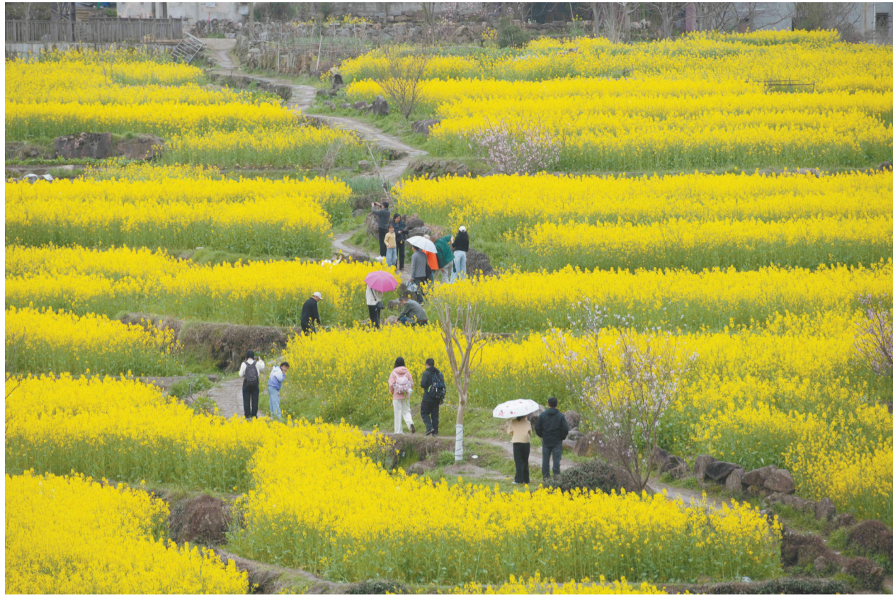
3月22日,游客在幸福村梅干岭油菜花田游玩。