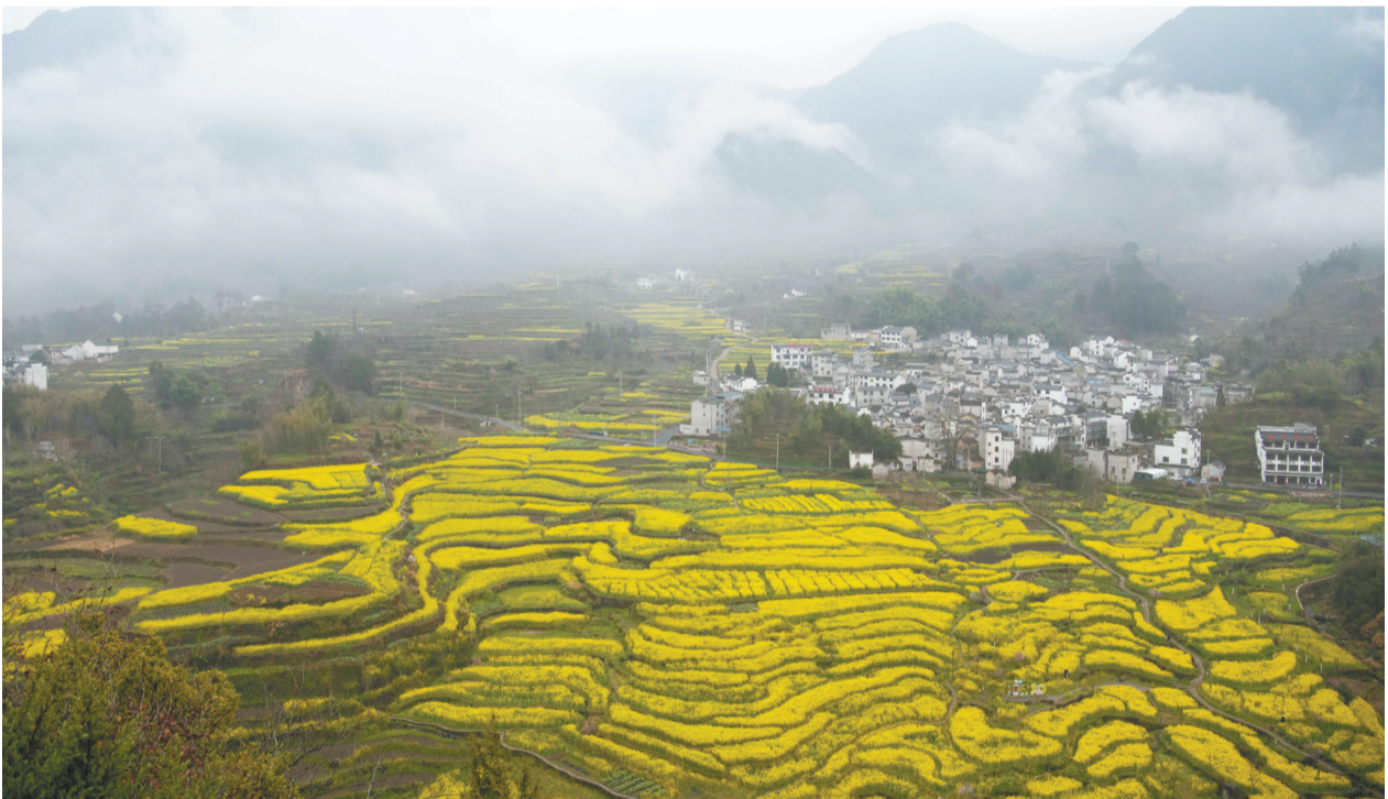
3月22日拍摄的幸福村梅干岭油菜花田(无人机照片)。