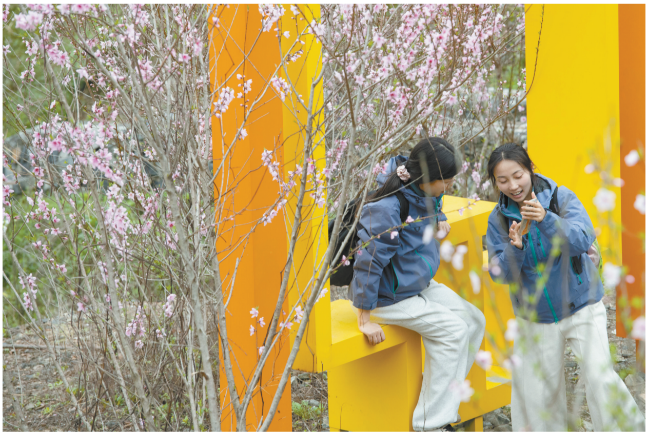
3月22日,游客在幸福村欣赏手机拍摄的照片。