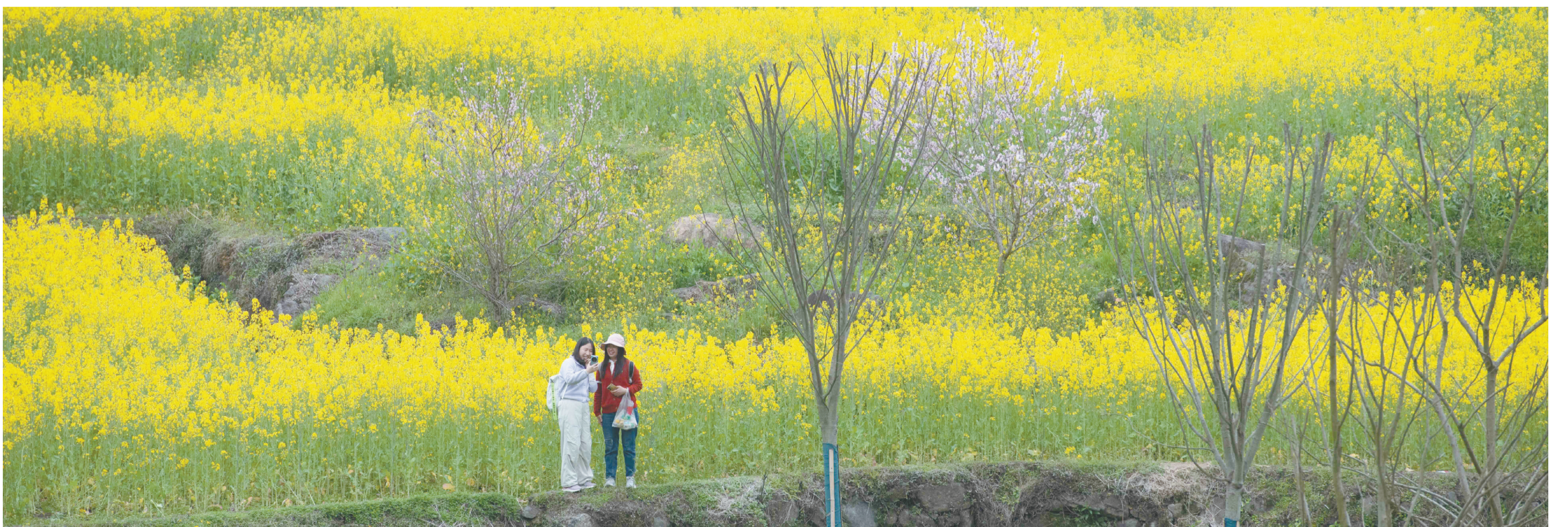
3月22日,游客在幸福村梅干岭油菜花田游玩。