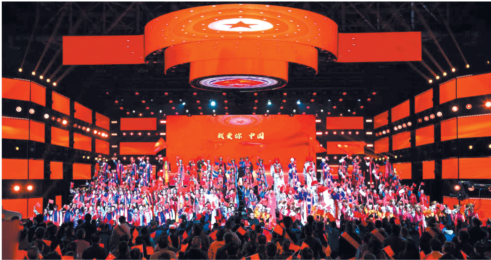
图为“盛世中国 幸福西藏”拉萨市纪念西藏民主改革67周年合唱比赛现场。

春到高原逢盛世,雪域欢歌颂党恩。今天,我们迎来了西藏民主改革67周年。连日来,我市各族各界干部群众通过举办丰富多彩的活动,回望光辉历程,礼赞伟大时代。