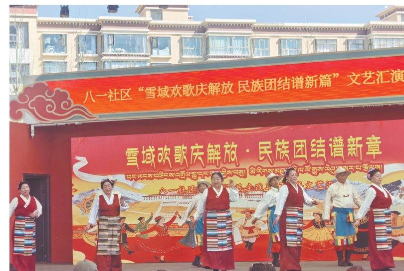
图为八一社区文艺汇演现场。