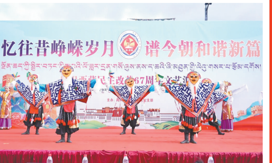
图为演职人员表演的传统舞蹈《扎西雪巴》。