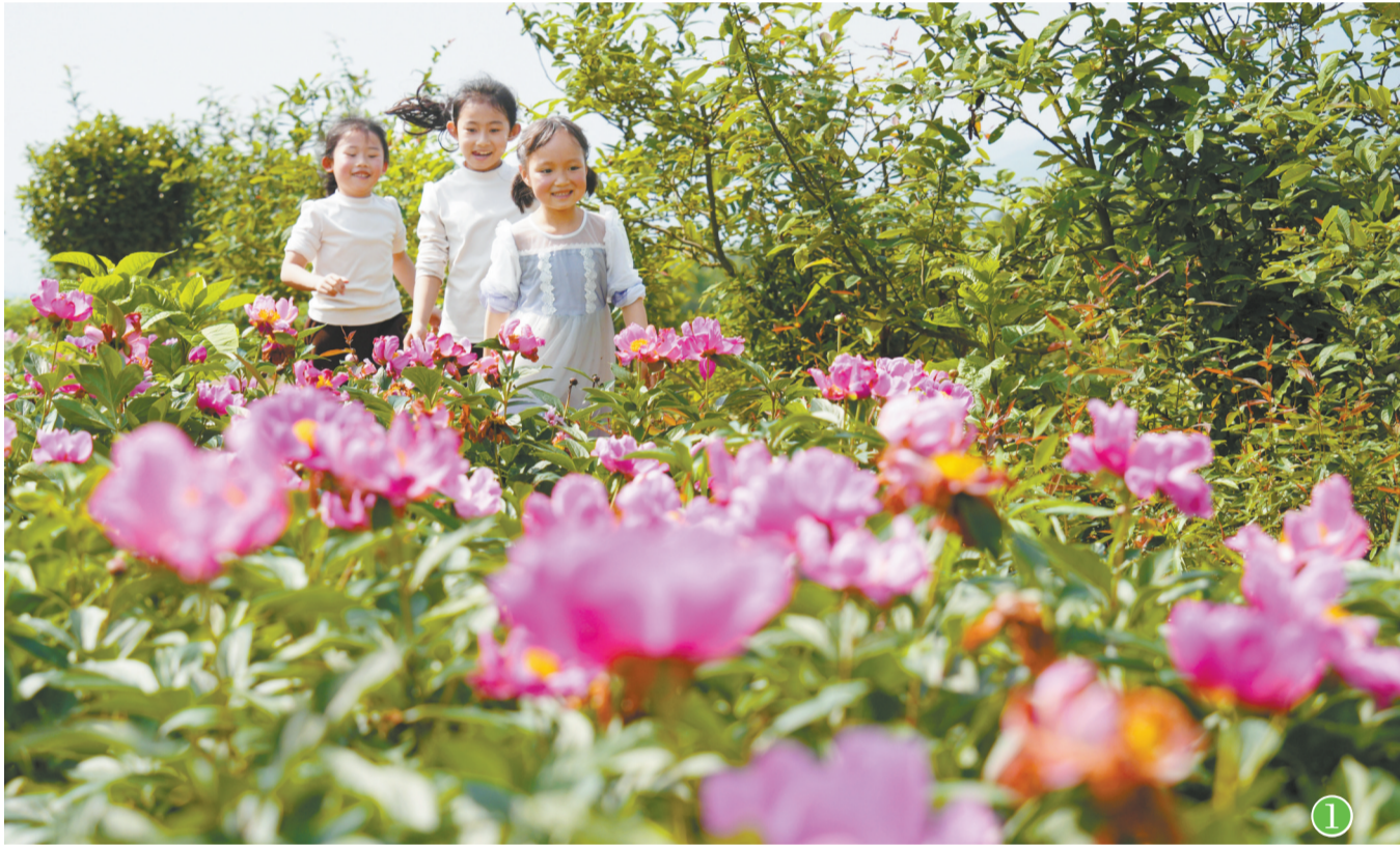
图①为4月19日,游客在湖南省祁东县白地市镇的芍药种植基地打卡游玩。