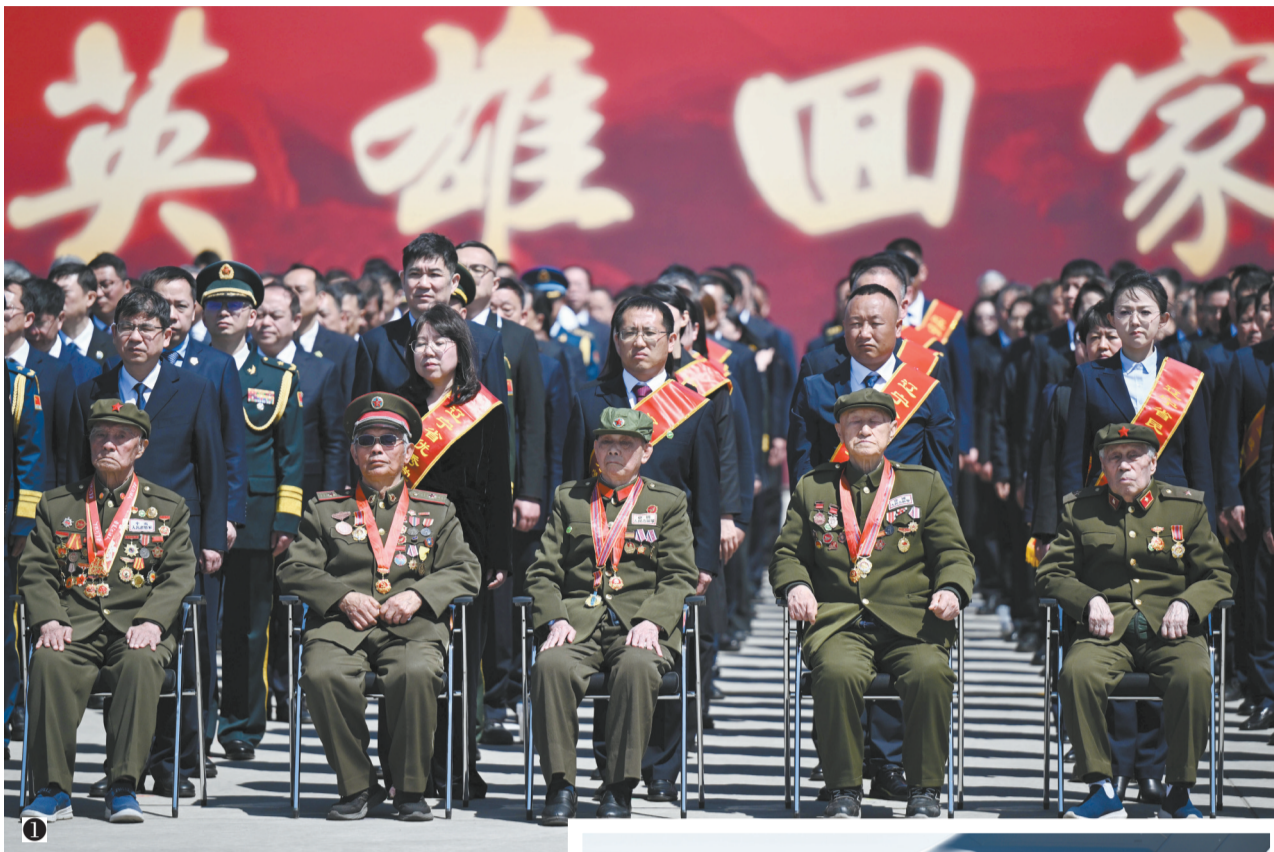
图片①④均为4月22日,第十三批在韩中国人民志愿军烈士遗骸由中国空军运-20B从韩国接回辽宁沈阳。这是迎回仪式现场。

自2014年以来,中韩双方遵循国际法和人道主义原则,已连续成功交接13批共1023位在韩中国人民志愿军烈士遗骸。