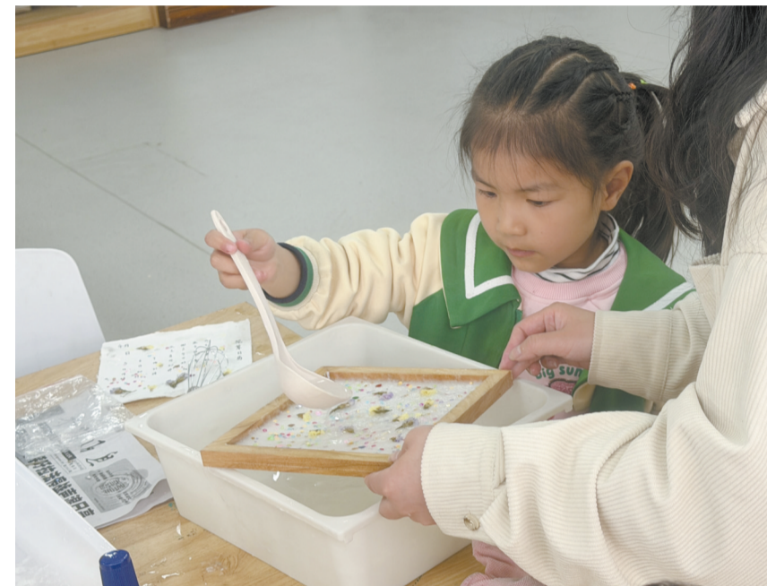
图为小朋友制作属于自己的花草纸。