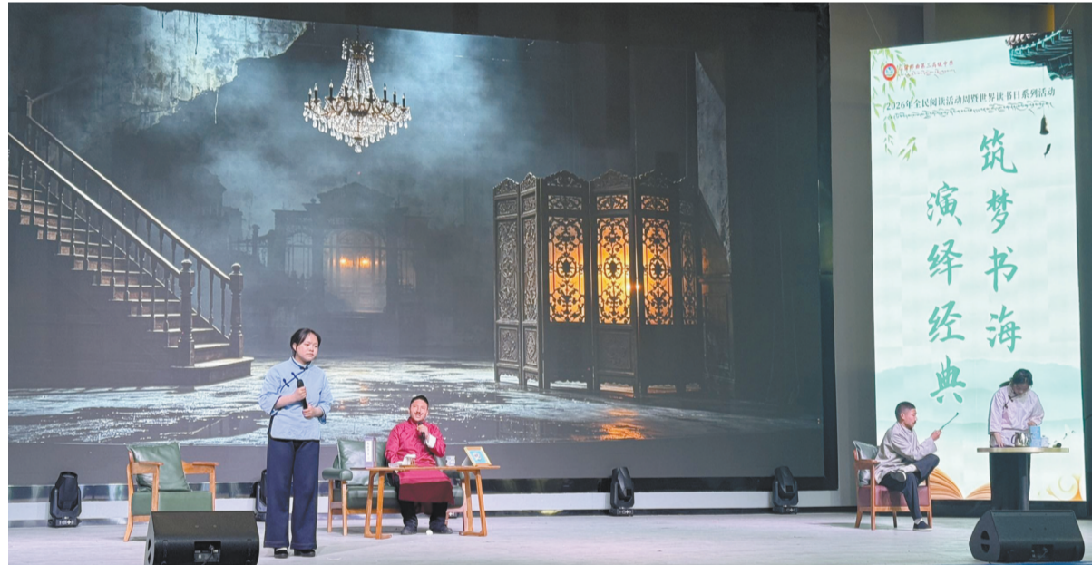
图为课本剧演绎活动现场。

拉萨融媒讯(记者次珍)4月23日,拉萨那曲第三高级中学精心开展“筑梦书海,演绎经典”世界读书日系列活动,以课本剧演绎、读书分享等多形式,让经典文学走出书本、跃上舞台,让书香浸润校园每一个角落。