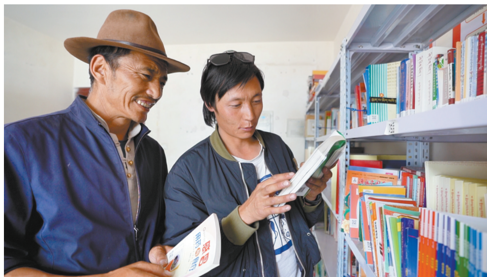
图为群众在农村书屋阅读。

下一步,墨竹工卡县将持续深化全民阅读活动,不断丰富阅读形式、拓展阅读阵地,让阅读成为一种生活习惯、一种社会风尚,以书香涵养城市文明,奋力建设书香满城、文明和谐的美好墨竹。