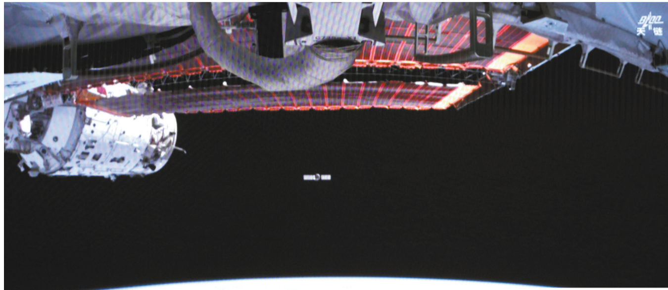
▲这是5月6日在北京航天飞行控制中心屏幕上拍摄的天舟九号与空间站分离画面。 ▼这是5月6日在北京航天飞行控制中心屏幕上拍摄的天舟九号与空间站分离200米停泊点模拟画面。

新华社北京5月6日电(李国利、杨欣)天舟九号货运飞船6日顺利撤离空间站组合体,将于近期择机受控再入大气层。 记者从中国载人航天工程办公室获悉,当日16时34分,天舟九号货运飞船顺利撤离空间站组合体,转入独立飞行阶段,将于近期择机受控再入大气层,飞船再入过程中烧蚀残存的少量残骸将落入预定安全海域。 2025年7月15日,天舟九号货运飞船从文昌航天发射场发射升空,成功对接于空间站天和核心舱后向端口。天舟九号货运飞船搭载了航天员在轨驻留消耗品、推进剂、应用实(试)验装置等物资。